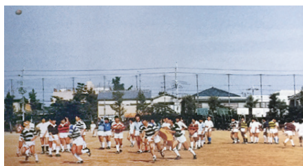
校庭で練習するラグビー部(1997年ごろ)

三年前にOB戦が開催された。現役の生徒は一名。大会には他校との合同チームで出ている模様。老いた自分は五分も走れなかった。でも幸福だった。豊高は近くに高い建物がない。久々にグラウンドから見上げた空は、広がった。青空に楯円球が浮かぶ。どこに弾むかわからない大事なものを、仲間と追っ。考える。話す。今動きながら、あの日も今も、さして変わっていないと思う。