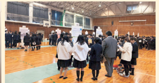
2/5 課題研究発表会(ポスター発表の様子)